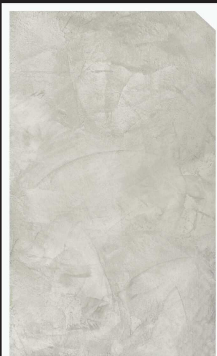
สีเทาอ่อน / Light Grey #AF-0102