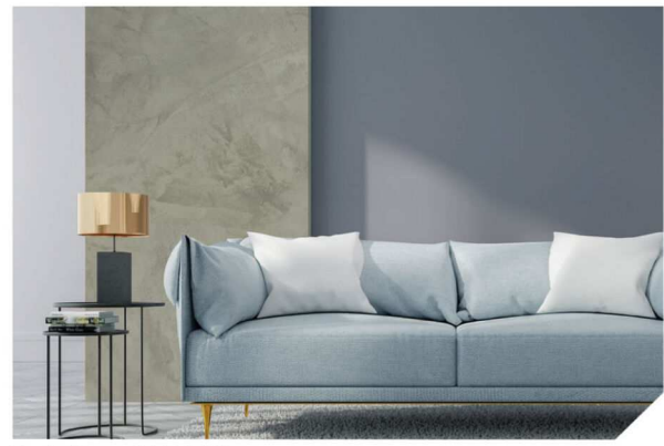
Dark Grey #AF-0103