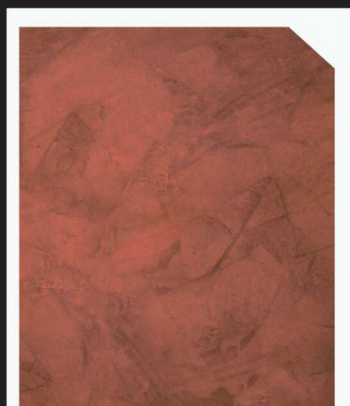
สีแดง / Red Clay Tile #AF-0201