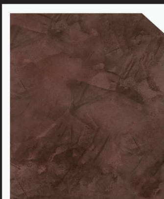
สีน้ำตาลเข้ม / Dark Brown #AF-0203