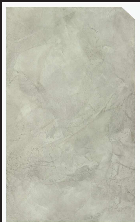
สีธรรมชาติ / Natural Grey #AF-0101