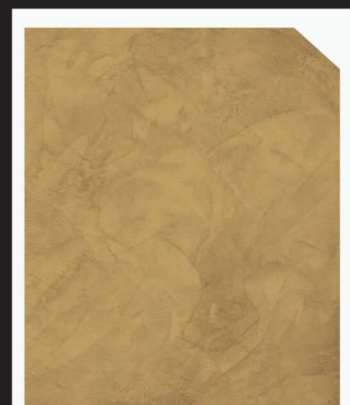
สีเหลือง / Yellow #AF-0205