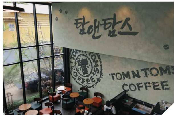
TOM N TOMS COFFEE SHOP - Natural Grey #AF-0101