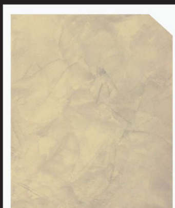
สีครีม / Cream #AF-0206