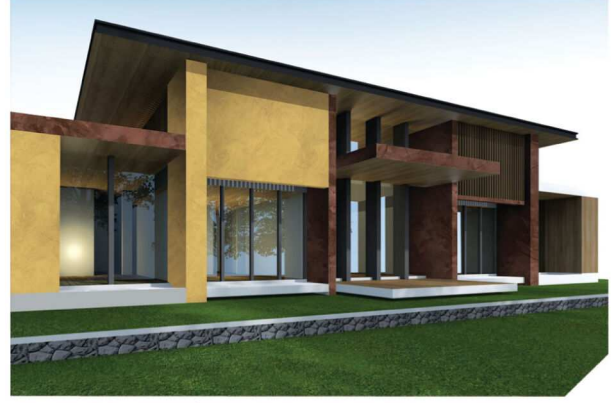
Yellow #AF-0205 / Dark Brown #AF-0203