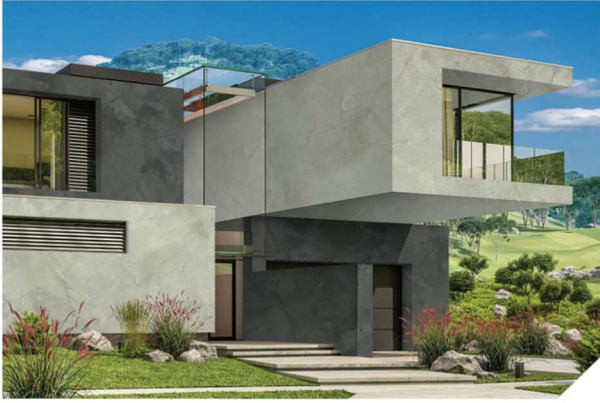
Natural Grey #AF-0101 / Dark Black #AF-0207