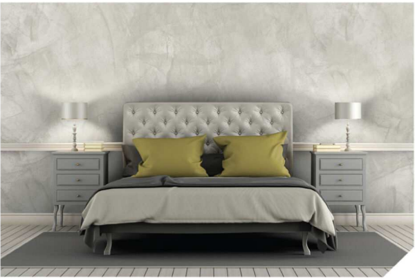
Light Grey #AF-0102