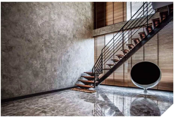
ออกแบบโดยบริษัท ลุก กู๊ด จำกัด - #AF-0101