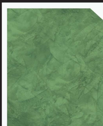
สีเขียว / Green #AF-0204