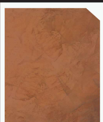
สีส้ม / Orange Punch #AF-0202