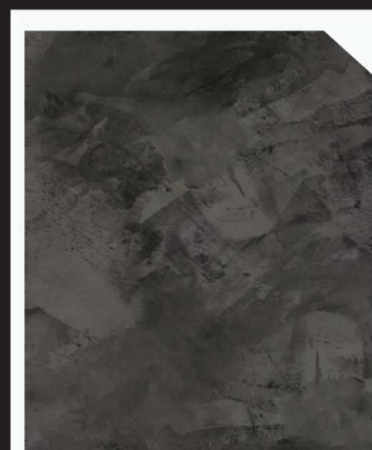
สีดำ / Dark Black #AF-0207

หมายเหตุ : รหัสสินค้า AF-02XX เป็นเจดสีสังเคราะห์ : ตัวอย่างเจดสีนี้ใกล้เคียงกับสีจริงเท่านั้น (The colour patterns shown on this card are approximate only)