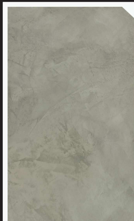
สีเทาเข้ม / Dark Grey #AF-0103