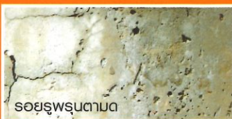
รอยรูพรุนตามด