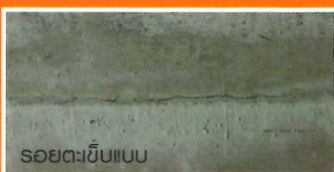
รอยตะขีบบน