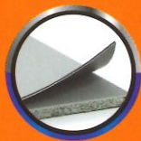
ปิดปิดพื้นผิว