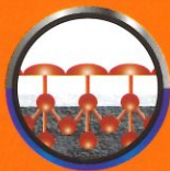
ยึดเกาะดี