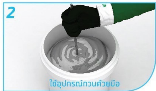
ใช้ อุปกรณ์กวนด้วยมือ

ข้อแนะนำ: ไม่ควรเติมน้ำลงใน เมอรั บอนด์ และเมื่อผสมแล้วควรใช้ให้หมดภายใน 1 ชั่วโมง