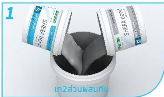
เท 2 ส่วน ผสมกัน