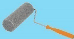
ลูกกลิ้ง