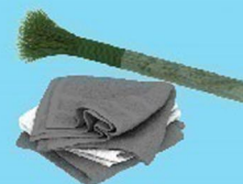
อุปกรณ์ทำความสะอาด