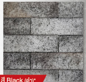
สี Black (ดำ)*

หมายเหตุ : * เป็นสินค้าสั่งผลิต (เงื่อนไขตามที่บริษัทฯ กำหนด กรุณาติดต่อบริษัทฯ ก่อนทำการสั่งซื้อ) ** รัศมีตัดโค้งสูงสุด 9 ซม. (คำนวณจากเส้นผ่านศูนย์กลาง 18 ซม.) *** สีสินค้าและพื้นผิวมีลักษณะ-คล-ก