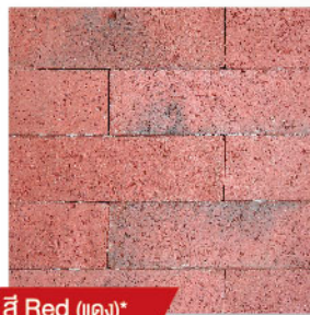
สี Red (แดง)*