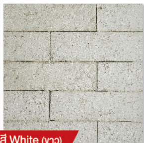
สี White (ขาว)