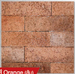
สี Orange (ส้ม)

ขนาด : 22 x 6.50 x 0.50 ซม. น้ำหนัก : 5.50 กก./กล่อง ปริมาณการใช้งาน : 1 กล่อง/ตร.ม. ปริมาณบรรจุ : 64 แผ่น/กล่อง