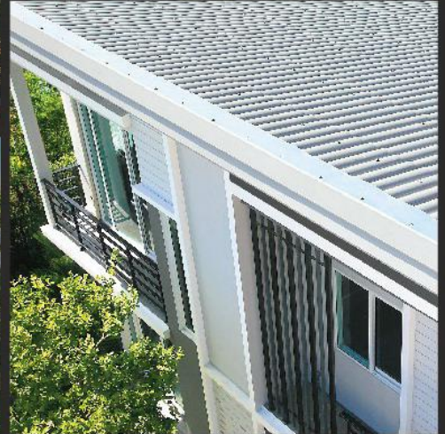
ที่มา: โครงการ คาซ่า ซิตี้ คอนเมือง บริษัท ควอลิตี้ เฮาส์ จำกัด (มหาชน)