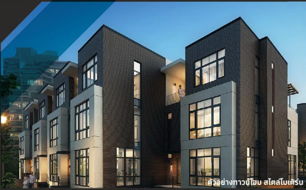
ตัวอย่างทาวโฮม สโกลิมเคิร์น