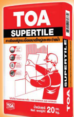
กาวซีเมนต์ ทีโอเอ ซุปเปอร์ไทล์ TOA SUPERTILE