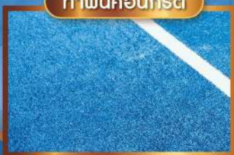
ทาพื้นคอนกรีต