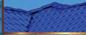
ทาปูนใต้ครอบหลังคา