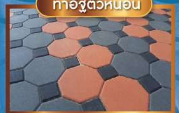
ทาคิวตัวหนอน