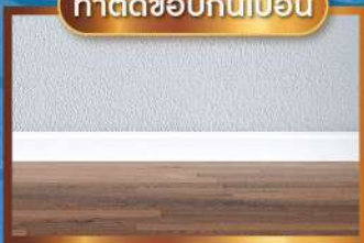
ทาดัดขอบกันเปื้อน