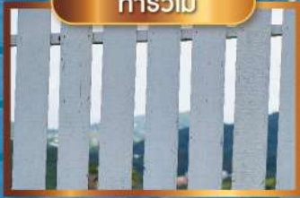
ทารั้วไม้