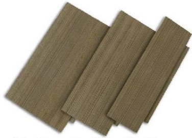
20 x 35 ซม.(cm) 15 x 35 ซม.(cm) 10 x 35 ซม.(cm)

ปริมาณบรรจุกล่อง เมอร์ซ่า ซีดาร์ เซค คอ 1 กล่อง (ปริมาณการใช้ 0.8 ตร.ม./กล่อง) SHERA zedar shake tiles per box, which will give a roof coverage area of 0.8 Sqm (including overlap)