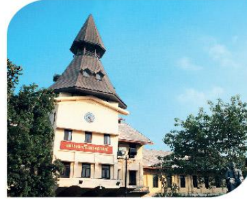
โดมมหาวิทยาลัยธรรมศาสตร์ ท่าพระจันทร์ Dome of Thammasart University Bangkok