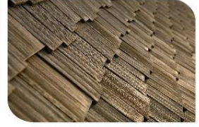
รีสอร์ท เซบีด คาบาน่า Samed Cabana Resort