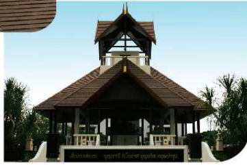
โบสถ์นักบุญยอแซฟ นครราชสีมา Saint Joseph's Church Nakhonratchasima