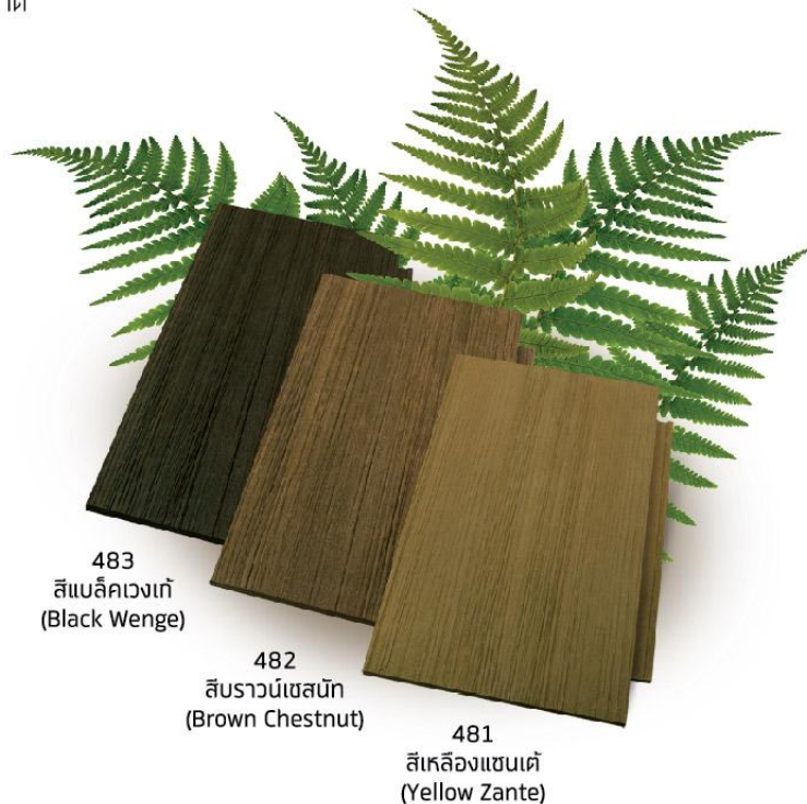
483 สีแบล็คเวงเก้ (Black Wenge)

อีกทั้งหน้ากว้างของผลิตภัณฑ์ทั้ง 3 ขนาด ในการสร้างสรรค์ดีไซน์ในจังหวะของธรรมชาติอย่างลงตัว พร้อมทั้งสีสันที่สวยงาม ด้วยเทคโนโลยีผสมสีในเนื้อของผลิตภัณฑ์ (Color Through) ออกมาเป็นสีเปลือกไม้ 3 ระดับ สีเหลืองแซนเต้ สีบราวน์เชสเตอร์ และ สีแบล็คเวงเก้ เพื่อช่วยตอบสนองการออกแบบได้อย่างกว้างขวางกว่าไม้ธรรมชาติ