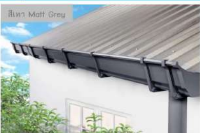
สีเทา Matt Grey