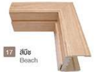
17 สีบีช Beach