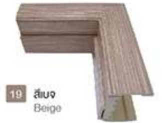
19 สีเบจ Beige