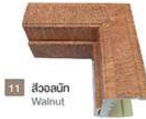
11 สีวอลนัท Walnut