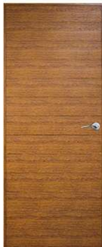
20 สีไม้สักทอง Golden Teak