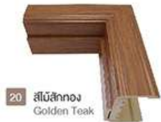
20 สีไม้สักทอง Golden Teak