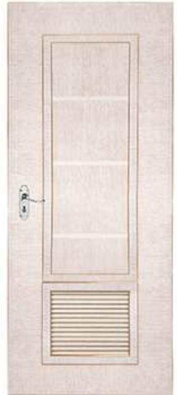
G12 สีงาช้างทอง Ivory - Gold