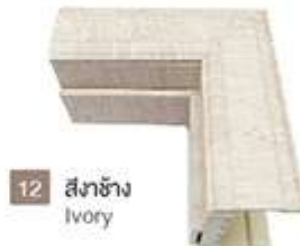
12 สีงาช้าง Ivory