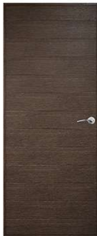
16 สีเบล็ค โคลโคนัท Black Coconut

สู่อีกขั้นของ Design ด้วย นวัตกรรมส่วนผสม High Impact Polystyrene (HIIPS) สุดยอดเยี่ยมที่ให้ความ หนาแน่นในเนื้อ Polystyrene ที่มากกว่าในเกรดพรีเมียม เราจึงคิดค้นประตูให้รับกับ การใช้งานภายในโดยเฉพาะ ความหนาประตู เพียง 38 mm. เบาจึงให้เหมาะกับการใช้งาน ลวดลาย และผิวสัมผัส เสมือนไม้มากกว่าใคร แต่แฝงด้วยความแตกต่าง ไม่ต้องทำสี ปลอดภัย น้ำไม่กลัว