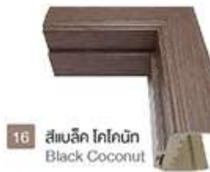
16 สีแบล็ค โคลโคนัท Black Coconut