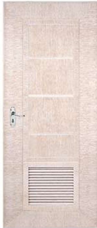
12 สีงาช้าง Ivory