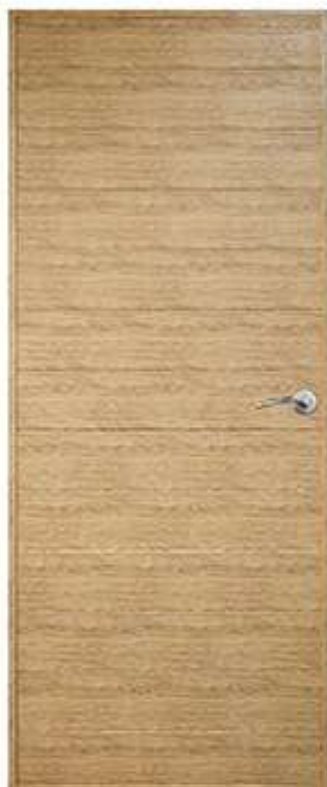
15 สีคานเก้า Kanekra