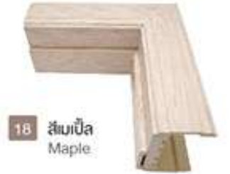
18 สีเมเปิ้ล Maple