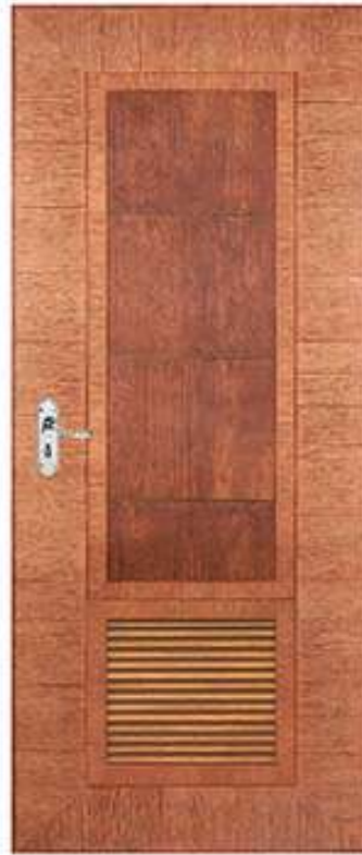
11 สีวอลนัท Walnut