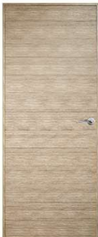
19 สีเบจ Beige