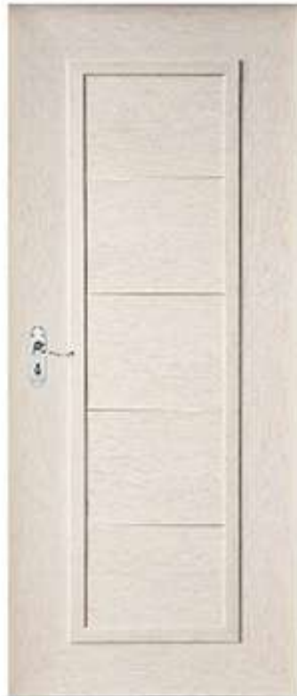
18 ส้มเบิ้ล Maple