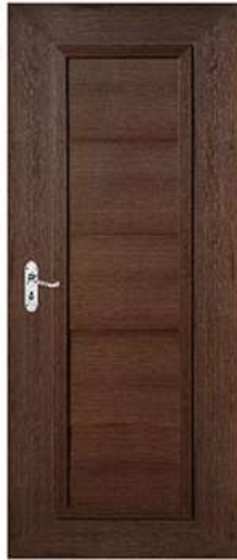
16 ส้มลัด โคลนัท Black Coconut