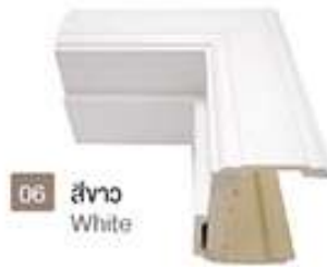
06 สีขาว White