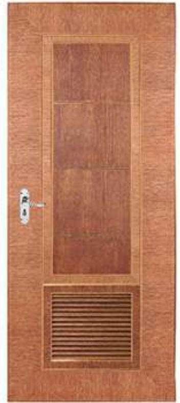
G11 สีวอลนัททอง Walnut - Gold