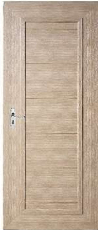
19 ส้มจ Beige