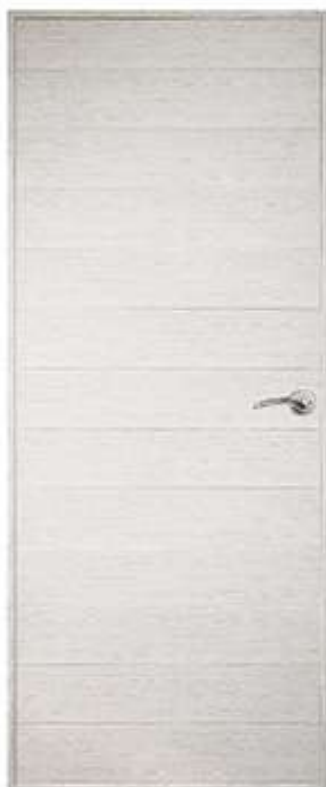
18 สีเมเปิ้ล Maple

สู่อีกขั้นของ Design ด้วย นวัตกรรมส่วนผสม High Impact Polystyrene (HIIPS) สุดยอดเยี่ยมที่ให้ความ หนาแน่นในเนื้อ Polystyrene ที่มากกว่าในเกรดพรีเมียม เราจึงคิดค้นประตูให้รับกับ การใช้งานภายในโดยเฉพาะ ความหนาประตู เพียง 38 mm. เบาจึงให้เหมาะกับการใช้งาน ลวดลาย และผิวสัมผัส เสมือนไม้มากกว่าใคร แต่แฝงด้วยความแตกต่าง ไม่ต้องทำสี ปลอดภัย น้ำไม่กลัว