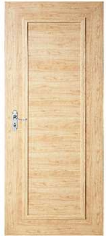
17 ส้มบีช Beach