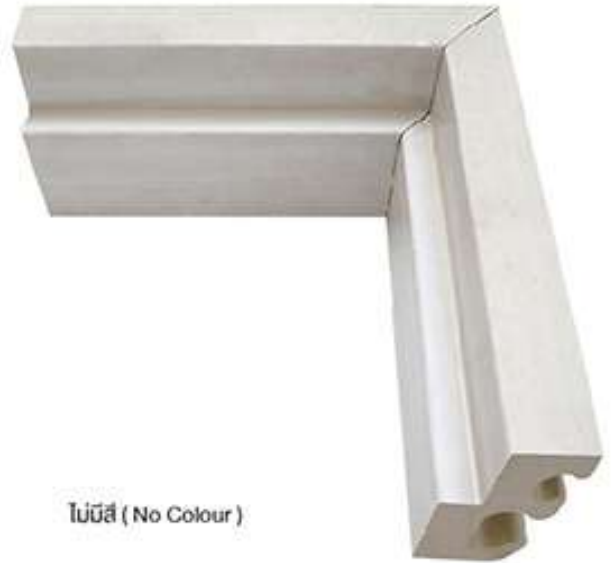
ไม่มีสี (No Colour)

วงกบประตูรุ่น JB ระบบการติดตั้งแบบเปียก 1 ชุด มาพร้อมกับ เหล็กฉาก และเหล็กสตัด