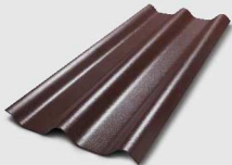
141 สีน้ำตาลคลาสสิก