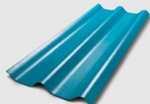
123 สีเขียวประกายพุดกษั