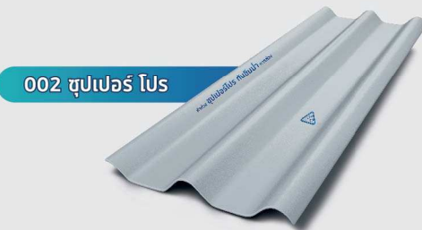
002 ซุปเปอร์ โปส