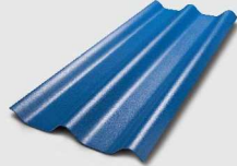
352 สีน้ำเงินคราม