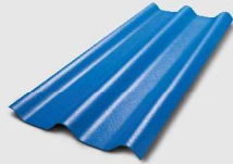
353 สีฟ้ารุ่งอรุณ