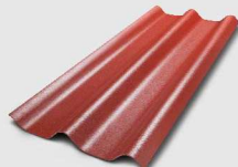
111 สีแดงอาภิศัยอัสดง