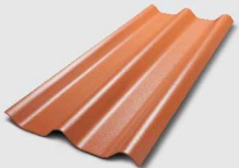
172 สีส้มศิลาแลง