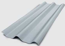
000 สีซีเมนต์