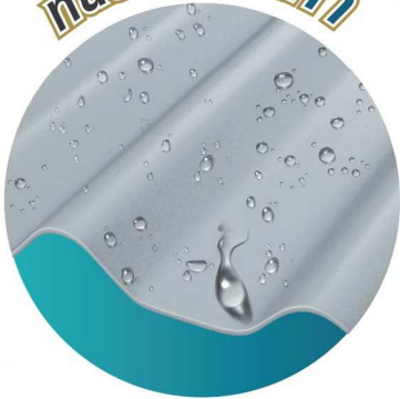
หลังคา ลอนคู่ Super Pro