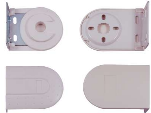
ขายึดเกียร์ รุ่น Y